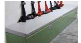
(10)シートクッション