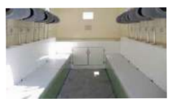
(22)フロアカーペット