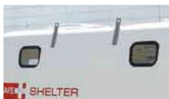
(2)ポリカーボネート製窓