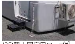
(25)陸上固定用ロープ*1