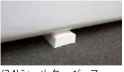
(24)シェルターベース