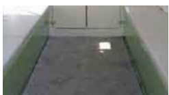
(23)フロアカーペット