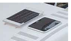
(22)太陽光蓄電システム