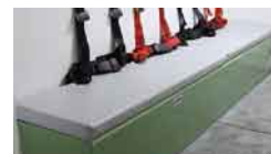
(10)シートクッション