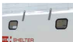
(2)ポリカーボネート製窓