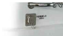
(20)100V電源引込装置(室外)*2