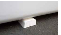
(25)シェルターベース