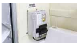
(20)100V電源引込装置(室内)*2