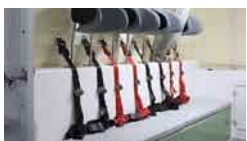
(11)4点式シートベルト