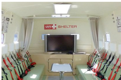
■LED 照明、テレビ、テーブル等で日常使いが快適な空間に