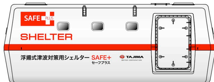
Side View - Door Side