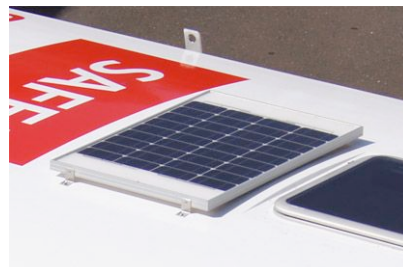
■ソーラーパネルからバッテリーへ蓄電し、いつでも電気を使用可能