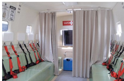
■カーテンで仕切ってプライベートな空間を確保(簡易トイレを使用)