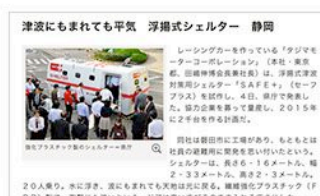
朝日新聞デジタル