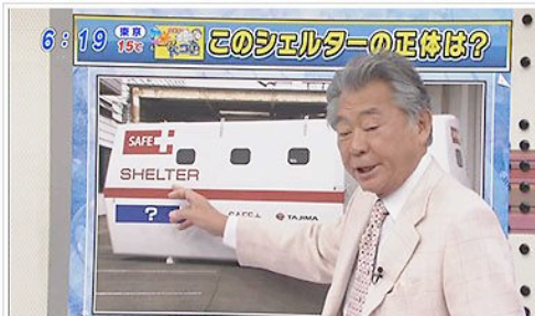
みのもんたの朝ズパッ! (TBSテレビ)