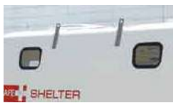
(2)ポリカーボネート製窓