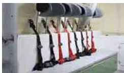
(11)4点式シートベルト