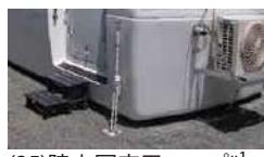
(25)陸上固定用ロープ*1