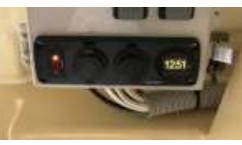
(19-5)DC12Vソケット(12V) (19-6)USBソケット(12V)