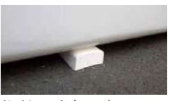
(24)シェルターベース