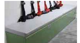
(10)シートクッション