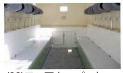
(22)フロアカーペット