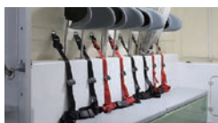
(12)4点式シートベルト