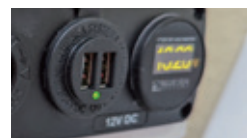
(23-4,5)12V USBチャージャー 12V 電圧計