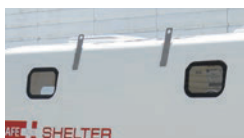
(2)ポリカーボネート製窓