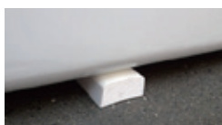
(22)シェルターベース