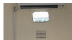
(24-3)100Vエアコン用 コンセント