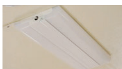
(24-4)100V LED 大型室内照明