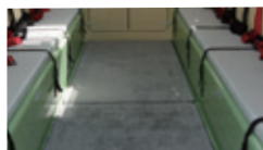
(14)フロアカーペット