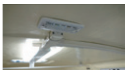
(23-6) 12V LED室内灯