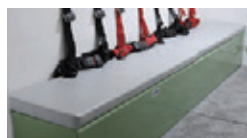
(11)シートクッション